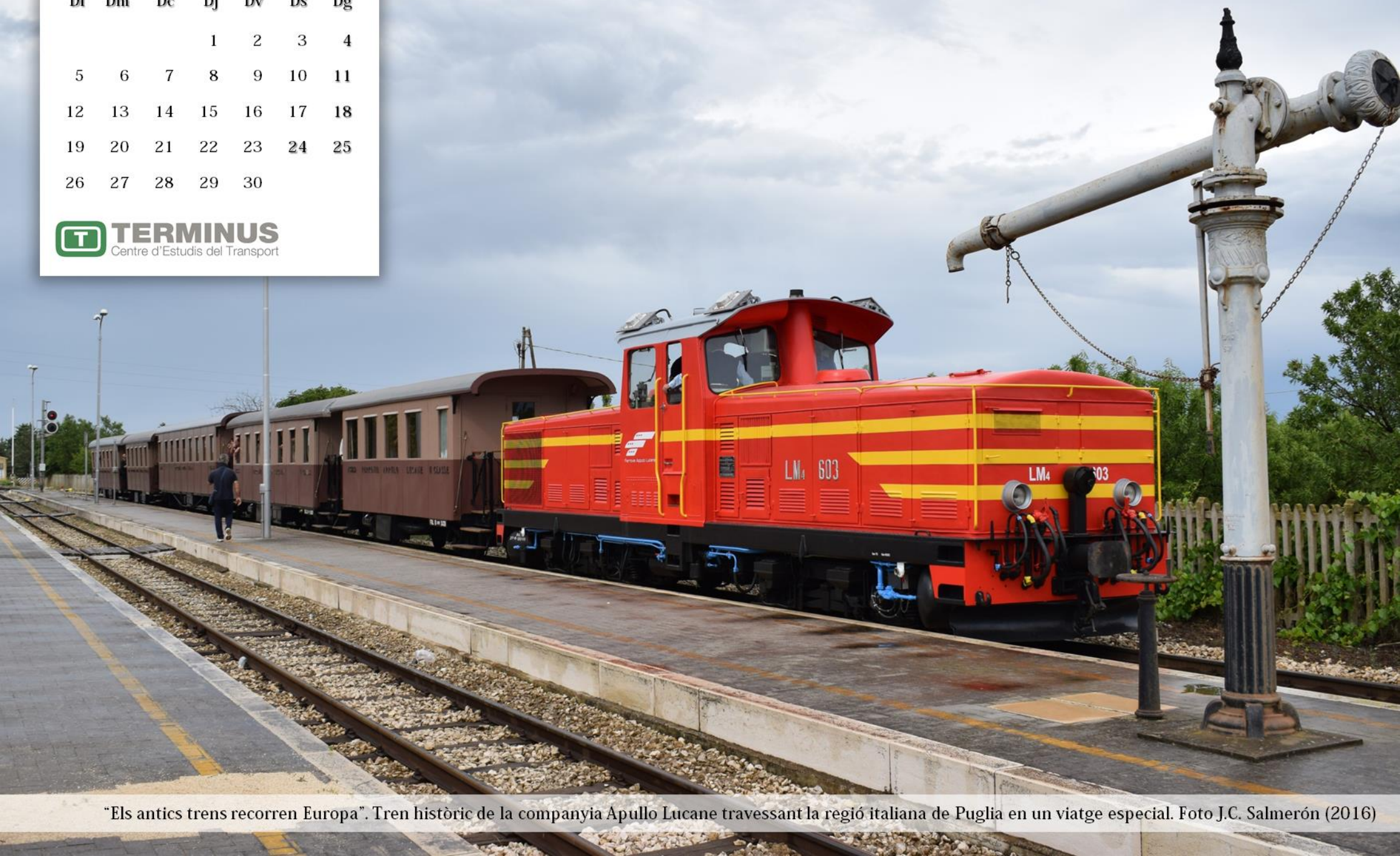
"Els antics trens recorren Europa". Tren històric de la companyia Apullo Lucane travessant la regió italiana de Puglia en un viatge especial.